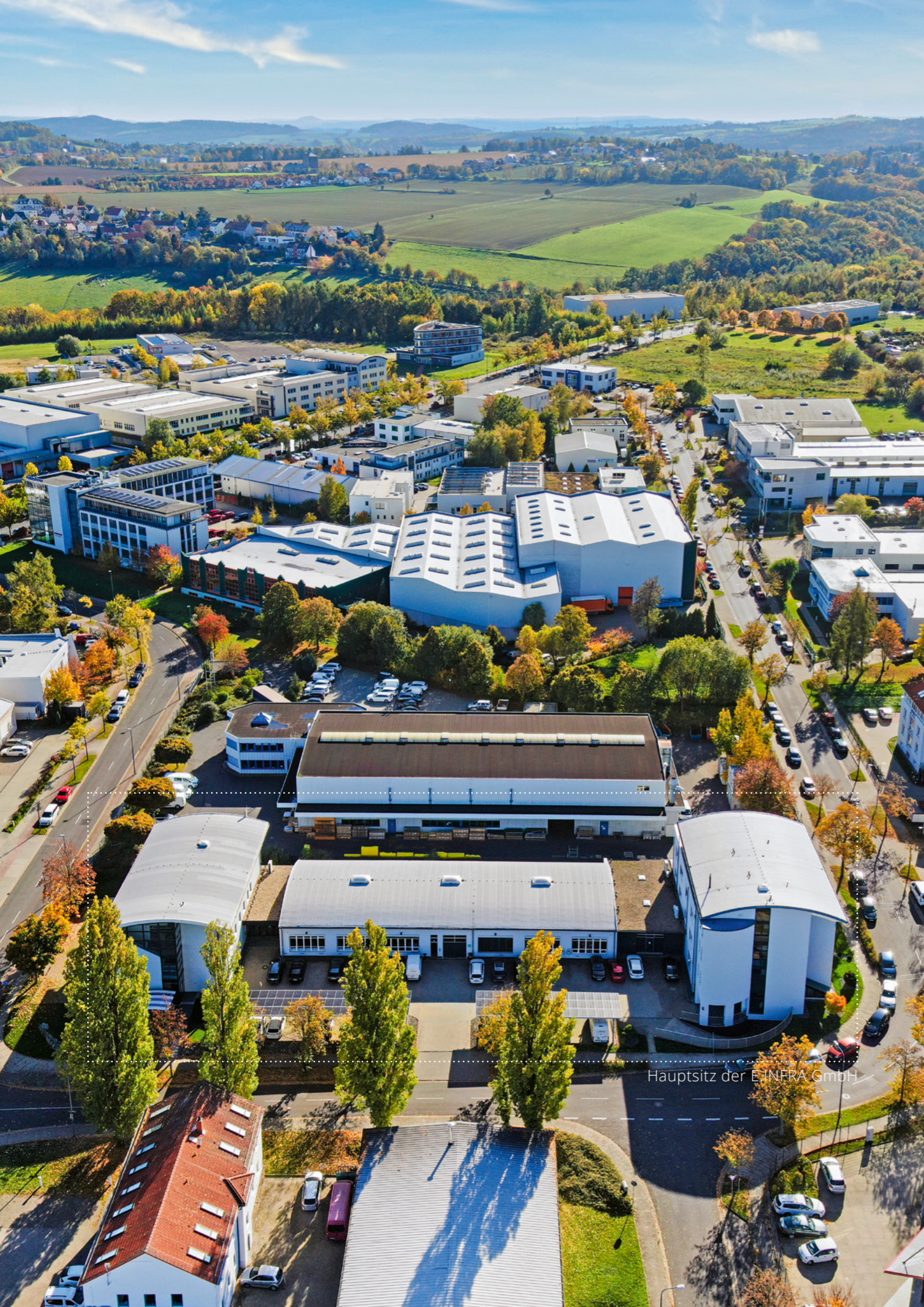
Hauptsitz der E.INFRA GmbH