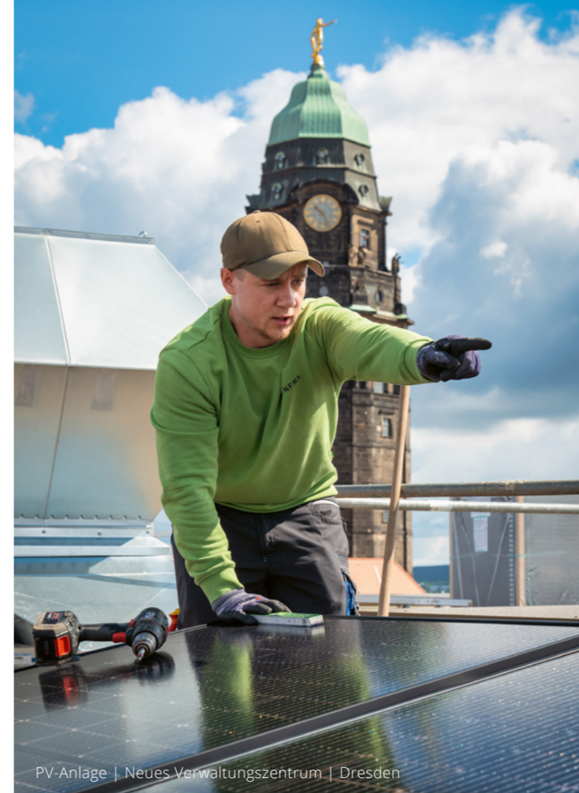
PV-Anlage | Neues Verwaltungszentrum | Dresden

Ab dem 1. Januar 2026 erweitert E.INFRA den Leistungsbereich der Sicherheitstechnik mit der Abteilung Türen um einen zentralen Baustein moderner Gebäudesicherheit. E.INFRA übernimmt die vollständige Umsetzung von der Planung bis zur fachgerechten Montage von Sicherheits- und Brandschutztüren mit elektronischen Anforderungen.