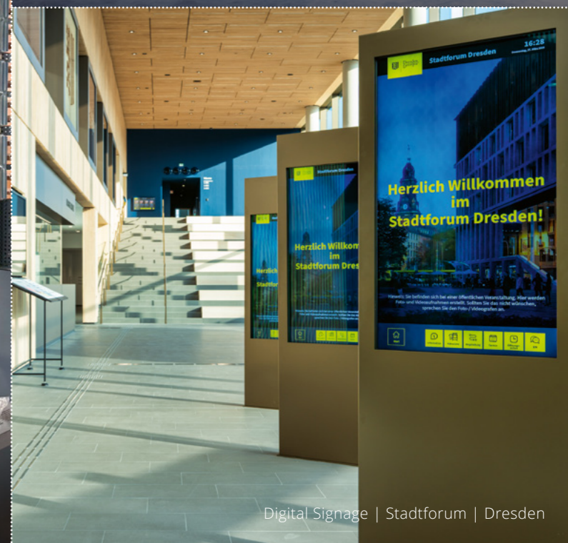
Digital Signage | Stadtforum | Dresden