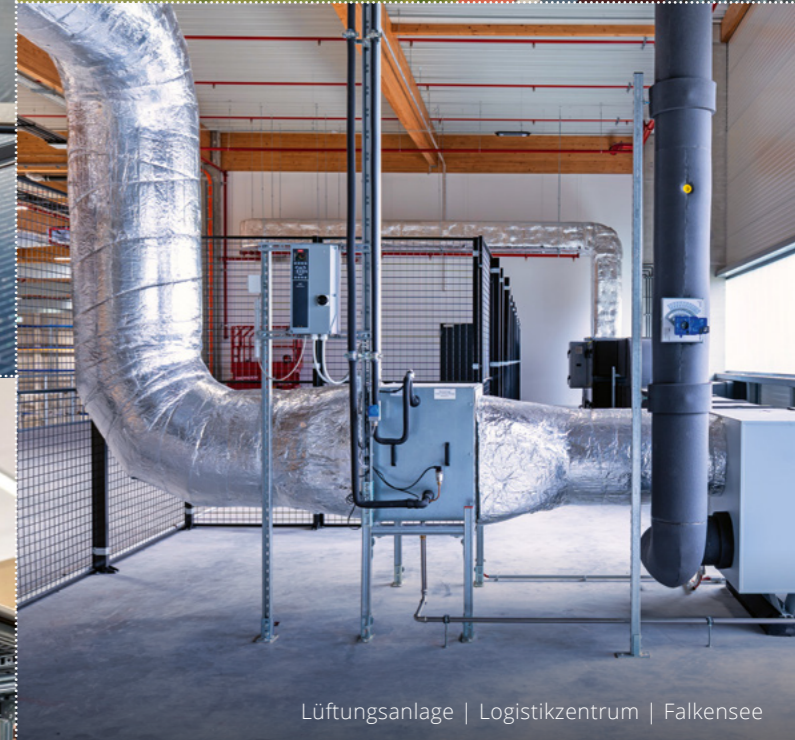
Lüftungsanlage | Logistikzentrum | Falkensee