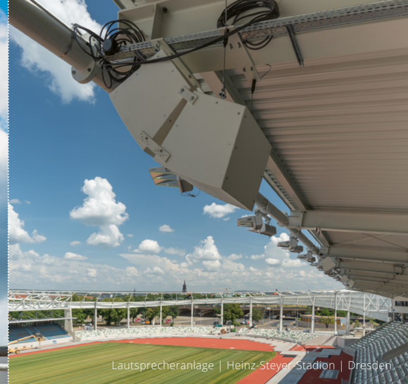
Lautsprecheranlage | Heinz-Steyer Stadion | Dresden