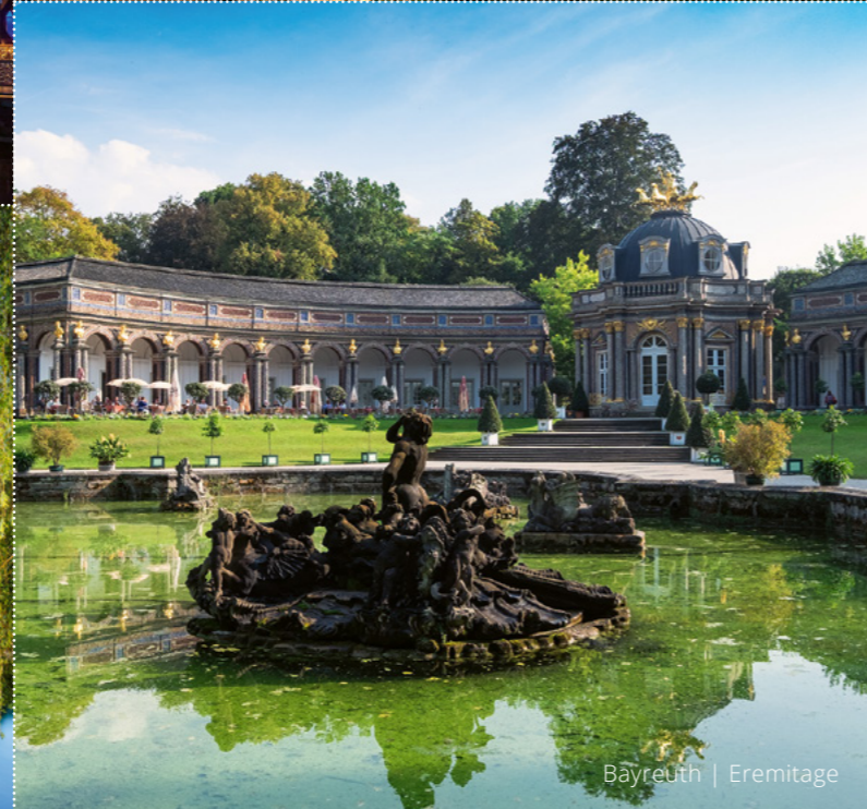
Bayreuth | Eremitage