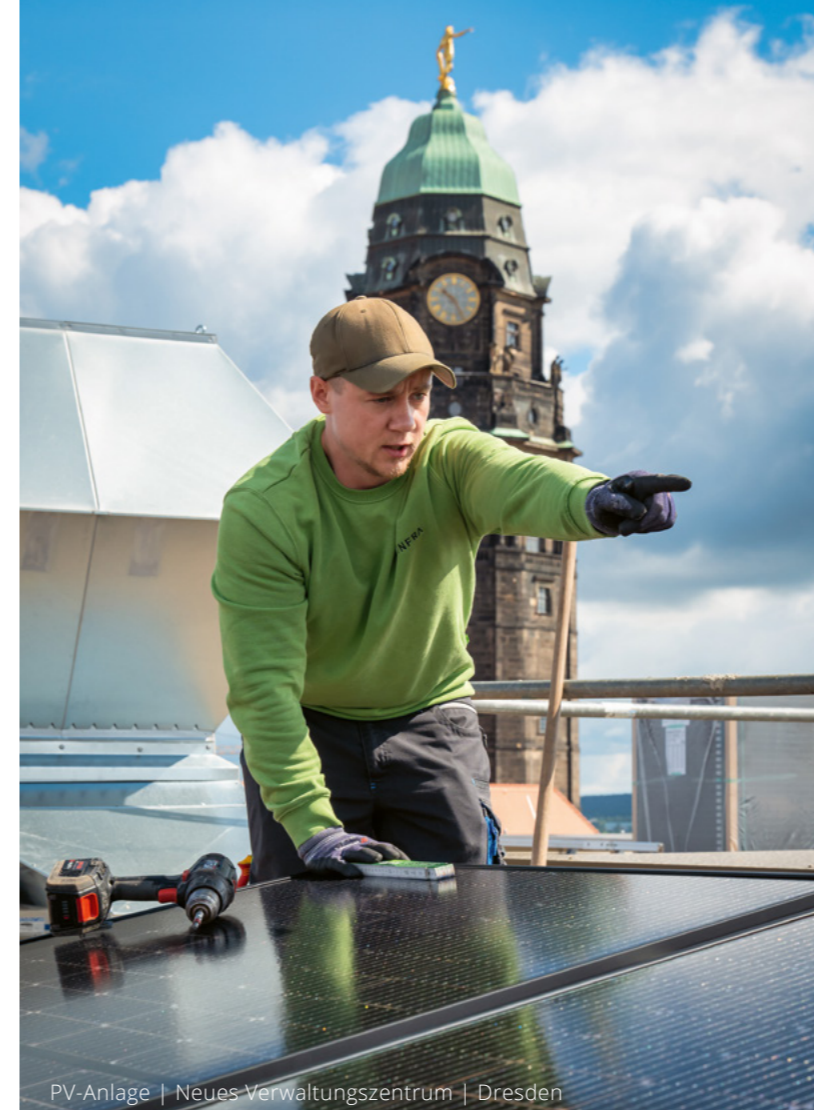
PV-Anlage | Neues Verwaltungszentrum | Dresden

Zum 1. August 2024 haben wir unseren Hauptsitz in Dresden um ein weiteres Gebäude in unmittelbarer Nähe erweitert. Das neue Gebäude auf der Heilbronner Str. 15 beheimatet zukünftig die Werkstatt für unseren Schaltanlagenbau sowie den Wareneingang und das Lager.