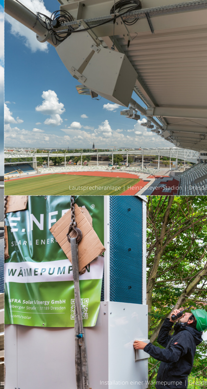
Installation einer Wärmepumpe | Dresden