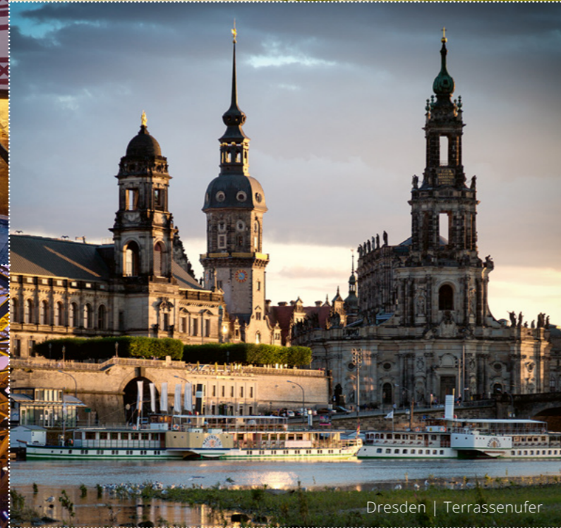
Dresden | Terrassenufer