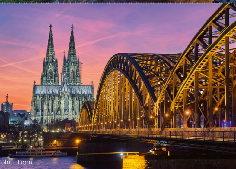
Köln | Dom