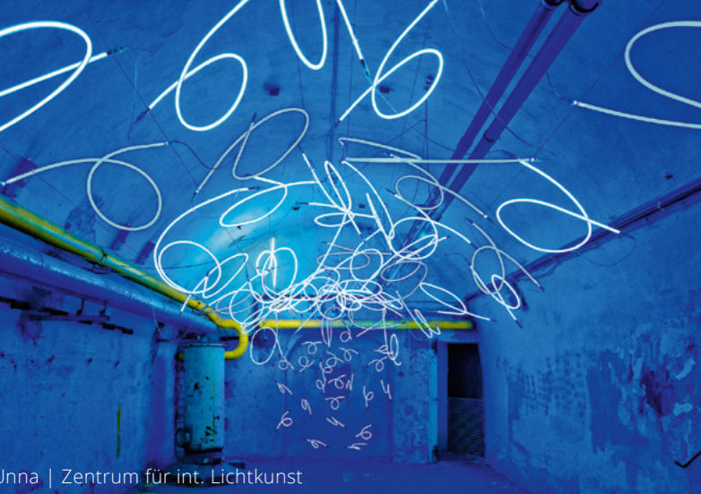
Unna | Zentrum für int. Lichtkunst