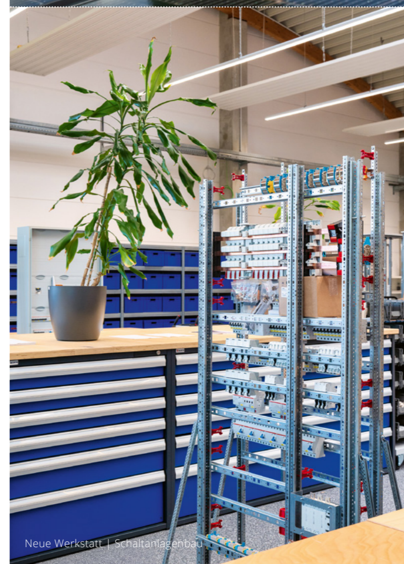
Neue Werkstatt | Schaltanlagenbau