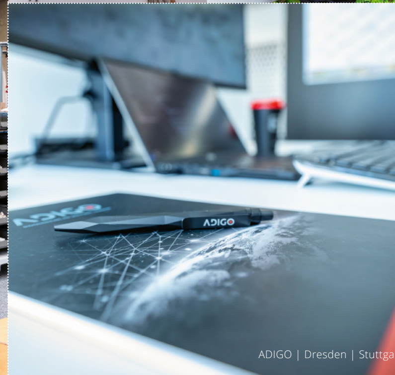
ADIGO | Dresden | Stuttgart