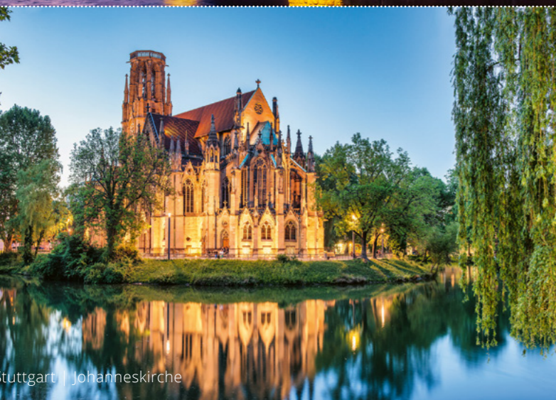
Stuttgart | Johanniskirche