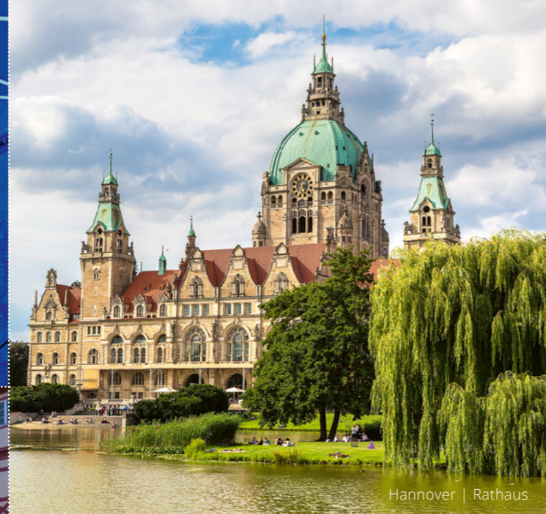
Hannover | Rathaus