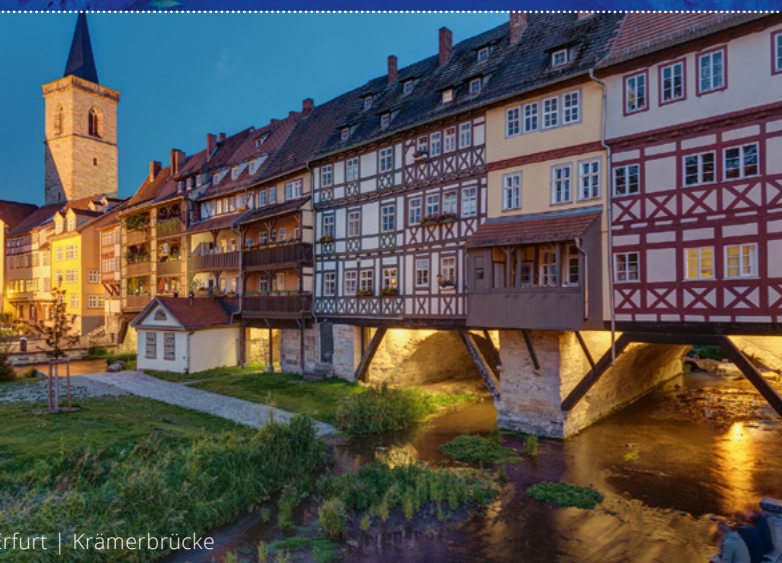
Erfurt | Krämerbrücke